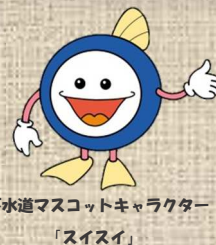
下水道マスコットキャラクター 「スイスイ」